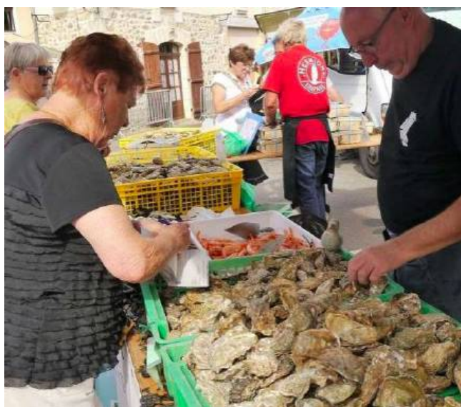
Étal d'huitres lors de la fête de l'huitre à Chéronnac

La reproduction, l'élevage, l'affinage et la qualité des huitres de Charente-Maritime , sont tributaires de la qualité des eaux de la Charente et de l'importance de son débit.