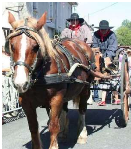
Cheval de trait et attelage traditionnel à Chéronnac

Ce sera l'occasion de rappeler l'importance de ce qui fut jadis le parcours fluvial et l'itinéraire terrestre du commerce du sel et des huîtres. En provenance des Côtes charentaises , ces produits de la mer arrivaient autrefois par voie fluviale sur la Charente jusqu'au Port l'Houmeau d'Angoulême . Les chargements des gabares étaient alors transbordés sur des chariots tirés par de robustes chevaux de trait, ou des bœufs limousins domestiqués, et acheminés par voies terrestres vers l'arrière pays et « remontaient » enfin jusqu'aux Sources de la Charente à Chéronnac !