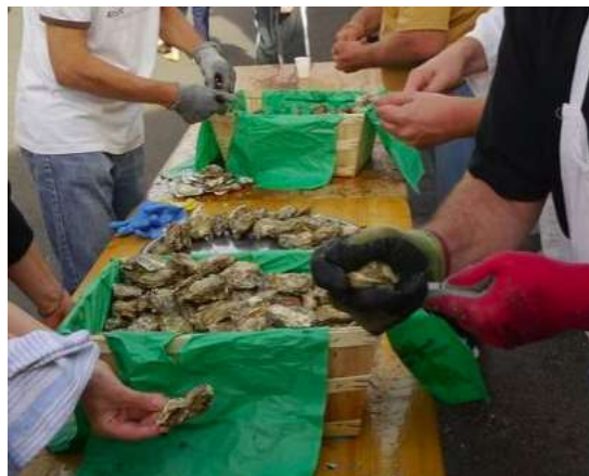
Ouverture des huitres à Chéronnac

Il sera aussi possible de se faire ouvrir des huitres par des écaillers expérimentés.